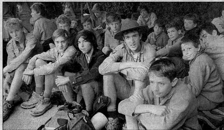
Rassemblement sous le préau de l'école avant le départ pour le lac de la Liez.

Mercredi matin, ils sont partis sous la pluie, en longeant le canal, direction le lac de La Liez pour y pratiquer des activités nautiques. Avec une soirée au sec car la commune de Peigney leur a mis à disposition la salle des fêtes.